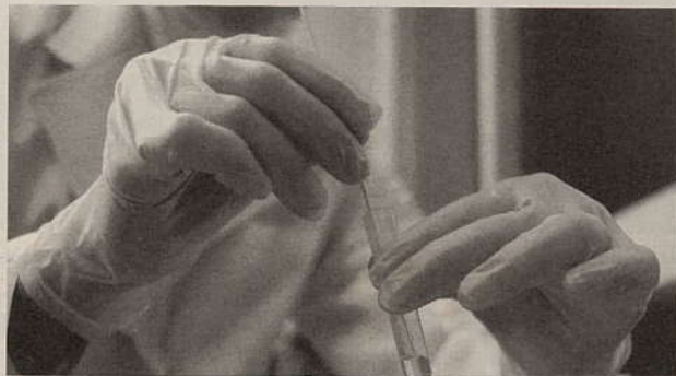
抽出液に粘膜細胞を移す。ウイルスがいれば液に溶け出す