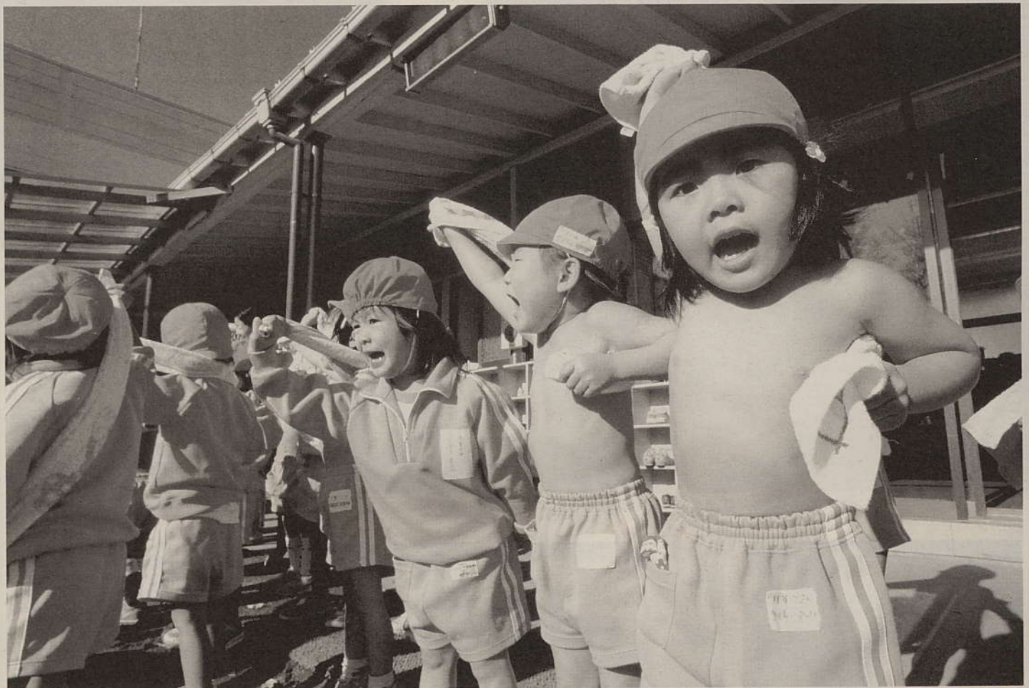
体を鍛えてインフルエンザ知らず。でもちょっと具合が悪ければすぐ受診を／東京都狛江市